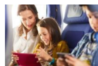
エコノミークラス

運航機材は、エアバス A340-300型機で、各座席数はビジネス30席、プレミアムエコノミー28席、エコノミークラス221席。総座席数は279席とビジネスとレジャー、双方の需要に適した機材で運航いたしております。