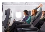
プレミアムエコノミー