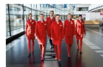
オーストリア航空スタッフ