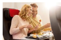
プレミアムエコノミークラス