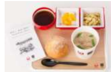
温野菜と鶏肉のマツ シュールームスープ