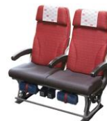
エコノミークラス 「JAL SKY WIDER」 116席 座席配列2-4-2

※上記の情報は、2026年6月12日時点の情報に基づきます。最新の情報はJAL Webサイトでご確認ください。