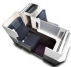
ビジネスクラス 「JAL SKY SUITE」 49席 座席配列2-3-2