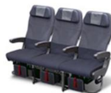
エコノミークラス 「JAL SKY WIDER」 147席 座席配列3-3-3