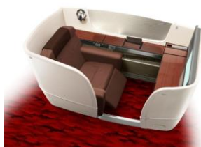
ファーストクラス 「JAL SUITE」 8席 座席配列1-2-1

※2026年6月10日時点でのスケジュールです。時刻は現地時間です。スケジュール・機種は予告なく変更となる場合がございます。