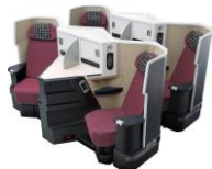
ビジネスクラス 「JAL SKY SUITEⅢ」 52席 座席配列1-2-1

JALボーイング787-9(E91) の運航です。快適な空の旅をお楽しみください。