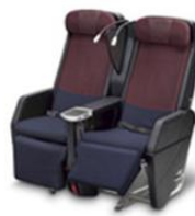
プレミアムエコノミークラス 「JAL SKY PREMIUM」 40席 座席配列2-4-2