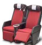
プレミアムエコノミークラス 「JAL SKY PREMIUM」 35席 座席配列2-3-2