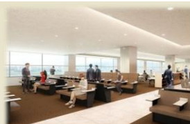
伊丹空港 ANA LOUNGE