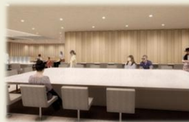
那覇空港 ANA LOUNGE