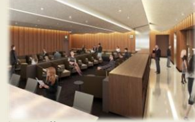
福岡空港 ANA SUITE LOUNGE