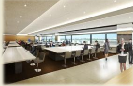
福岡空港 ANA LOUNGE