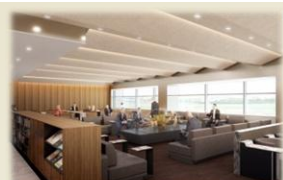
伊丹空港 ANA SUITE LOUNGE