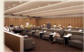
那覇空港 ANA SUITE LOUNGE

※ 面積は「ANA SUITE LOUNGE」および「ANA LOUNGE」の合計です。