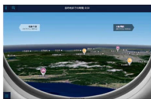
機窓からの景色例