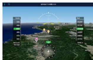
コックピットからの景色例