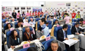
お客様役の役職員も真剣です

「OMOTENASHI MASTER」 ピンバッジ（ファイナリストに授与） 機内でも着用しています。